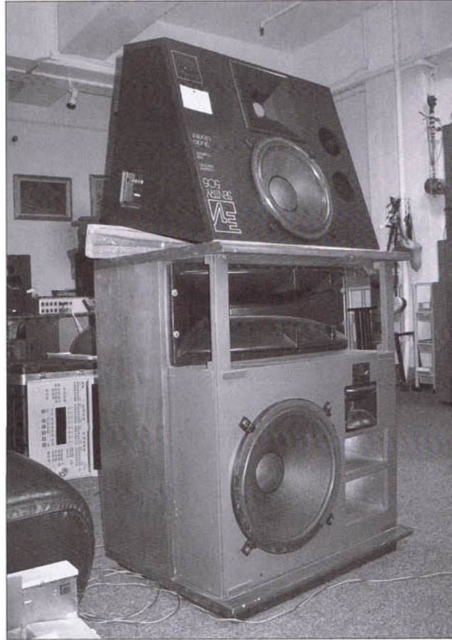
一對古董 EV 專業仔寶，上面是 Sentry 505，下面是 Sentry 3。

的錄音連番報捷，特別是 LPCD1630 的推出，所以在公在私都值得採訪一下，於是大家就相約了一個下午到《雨果》與老易見面。