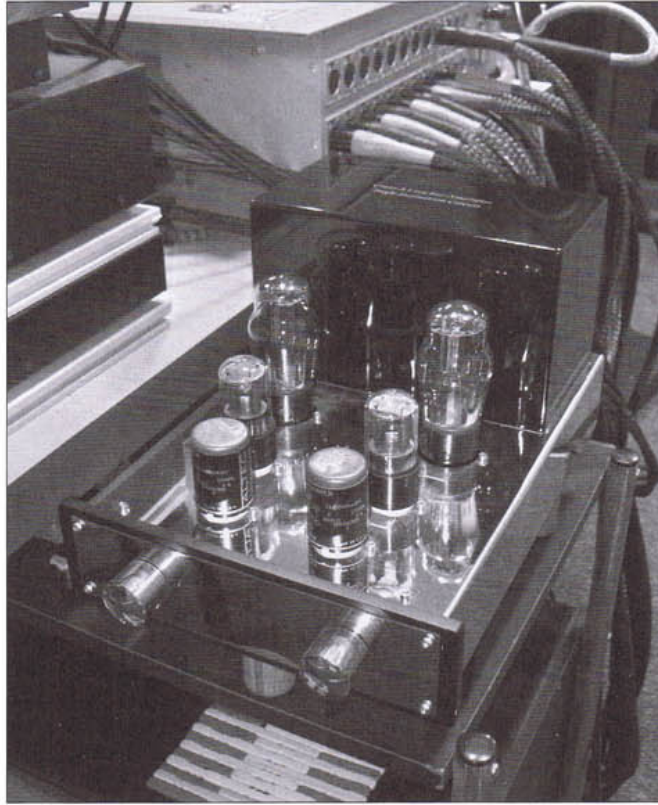
經 No.23 Pro 調聲之後，聽感的確更豐富、更好味。

後才去製版，而在這段過程中，No.23 Pro 則發揮著調味作用。易兄說，他選擇 No.23 Pro 的原因，不單是它膽味十足，更重要是此機具有獨特的個性，例如某些女聲錄音，當通過它之後，感情和味道都會更濃厚，而這正是現下一般錄音室器材所缺乏的。於是，我們就此即席試聽，結果亦一如易兄所說。此外，我們亦同場比較了錄音母帶與 LPCD 的分別，最後發覺兩者的差