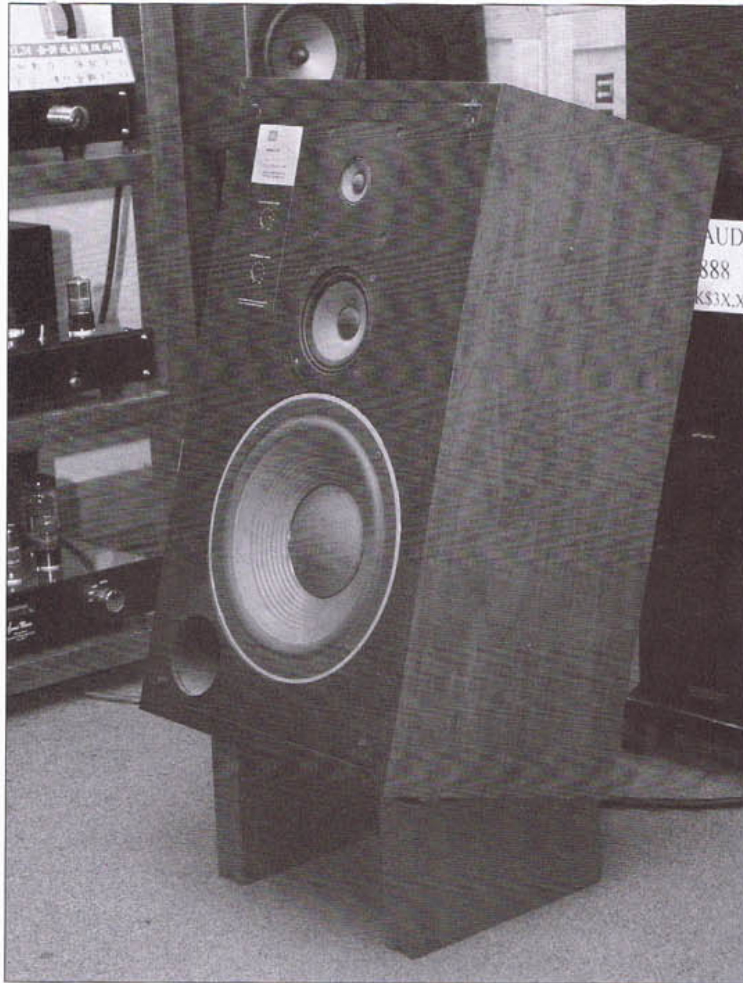
雖然 L50 在古董 JBL 中屬普通貨色，但在這裡的表現卻令人意想不到。