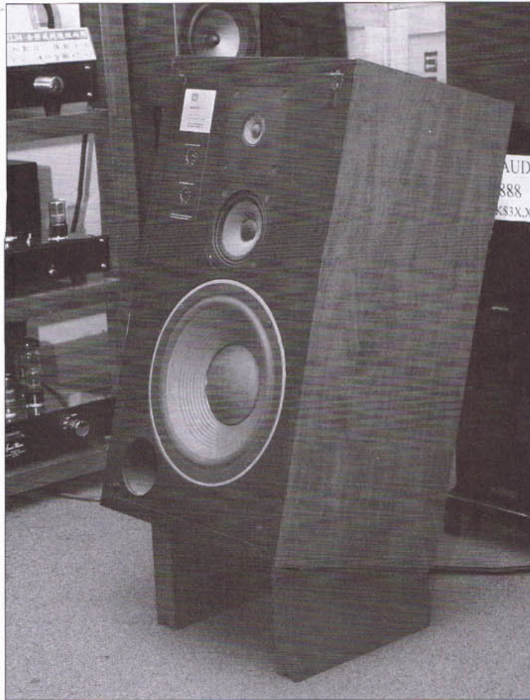
雖然 L50 在古董 JBL 中屬普通貨色，但在這裡的表現卻令人意想不到。