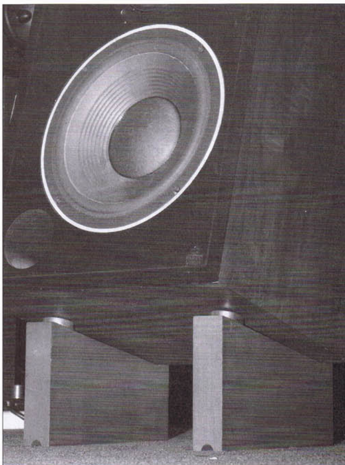
特別為 JBL 古董音箱打造的 HOBBY LAB 石墨腳。